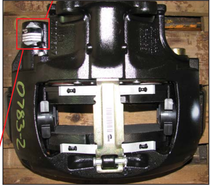
FIGURA 1 - Identificación de calibrador Bendix

Nota : Los Calibradores de la derecha e izquierda tendrán el número de serie en lados opuestos del calibrador.